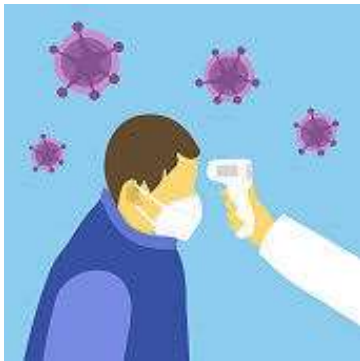
Termómetro infrarrojo sin contacto frontal