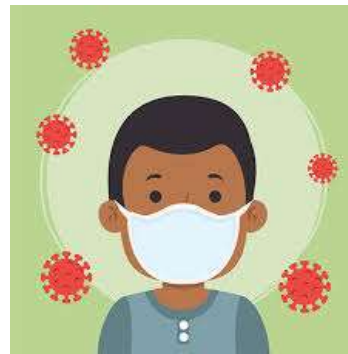
Mascarillas higiénicas *